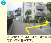
少しわかりづらいですが、家の右脇をまっすぐ進みます。

東京の南部に位置する大田区は商工業を中心に発展している大変活気ある街です。本校は駅前 駅前 の喧騒から少し離れた静かな住宅街にあり、学業に集中出来る環境にあります。鉄道もJRを含め4線2駅が利用でき、羽田空港も同じ大田区にあり、各方面からのアクセスが可能です。 ※徒歩ルートもありますが右のバスアクセスもご参照下さい。