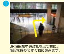
JR蒲田駅中央改札を出て右に、階段を降りてすぐ右に進みます。