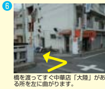
橋を渡ってすぐ中華店「大陸」がある所を左に曲がります。