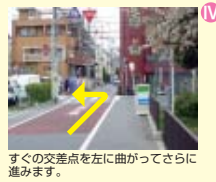
すぐの交差点を左に曲がってさらに進みます。