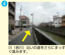
川（香川）沿いの道をさらにまっすぐ進みます。