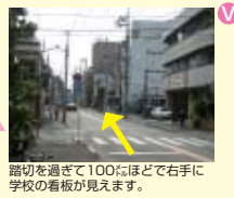
踏切を過ぎて100ほどで右手に学校の看板が見えます。