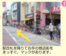
駅改札を降りて右手の商店街をまっすぐ、マップがあります。