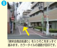
「錦栄会商店通り」を入りそこをまっすぐ進みます。カラータイルの道路が目印です。