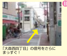
「大森西四丁目」の信号をさらにまっすぐ！