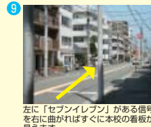
左に「セブンイレブン」がある信号を右に曲がればすぐに本校の看板が見えます。