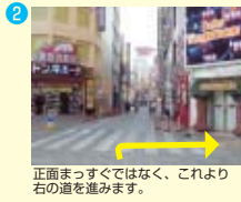
正面まっすぐではなく、これより右の道を進みます。

JR蒲田駅西口より徒歩15分（香川沿いを歩いて下さい） 京急大森町駅より徒歩12分