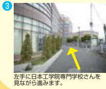
左手に日本工学院専門学校さんを見ながら進みます。