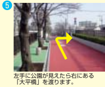
左手に公園が見えたら右にある「大平橋」を渡ります。