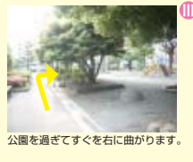
公園を過ぎてすぐ右に曲がります。